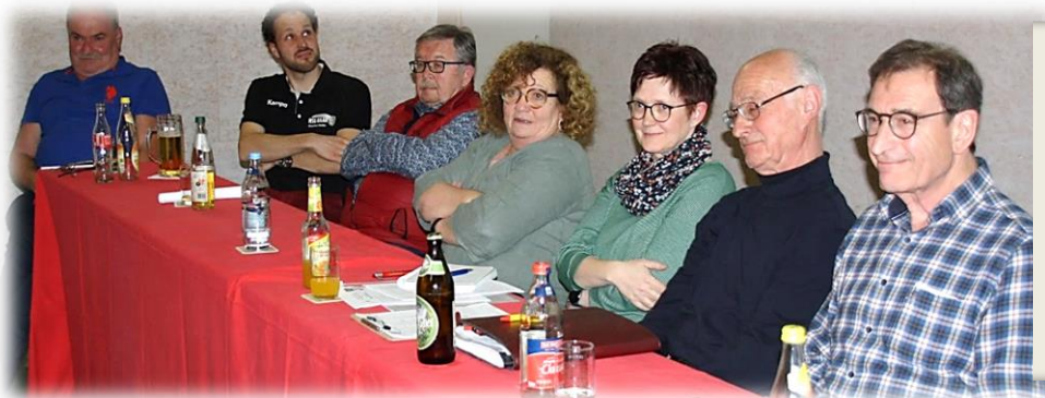
Einige Mitglieder des Vereinsrats ➔ dem Gesamt-Vereinsrat herzlichen Dank für die unermüdliche Arbeit!