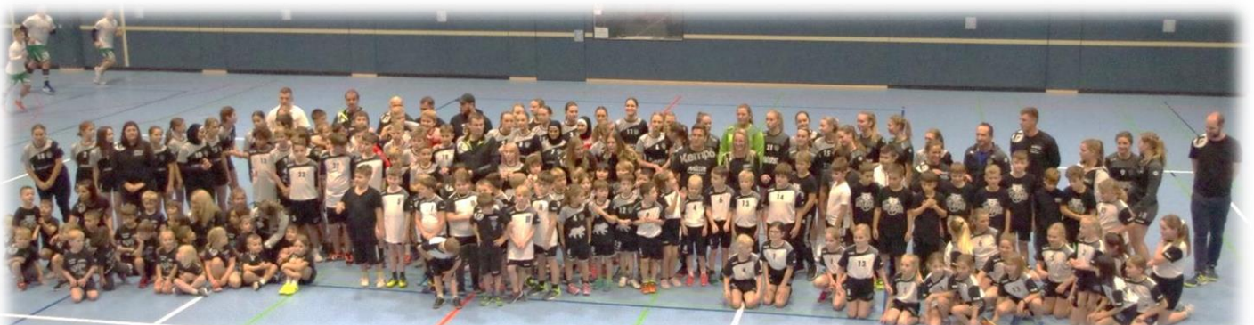
Vorstellung der Jugendmannschaften

Der Sponsorentag am Samstag, dem 24.02.2024 war ein voller Erfolg. Nach dem Spiel der Frauen 1 wurden alle Jugendmannschaften vorgestellt. Die kleinsten Mitstreiter, die Minis und die F-Jugend, wurden noch mit einem HSG-Baar T-Shirt ausgestattet, welches sie voller Stolz präsentierten. Auf vollen Rängen konnte man sich danach noch das Spiel der Herren 1 anschauen. Vielen Dank an alle, die hier mitgewirkt haben.