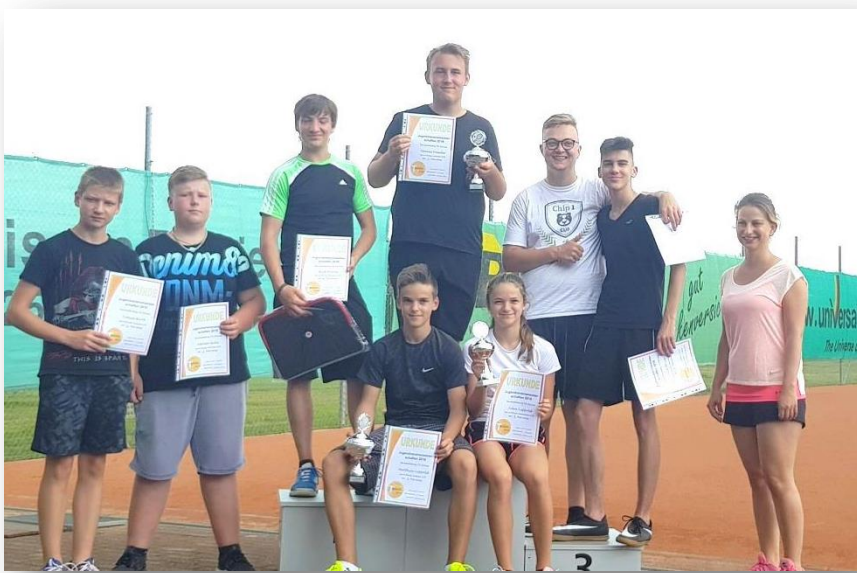
Unsere Jugendsieger 2019

Die Jugendlichen bestritten mit großem Eifer ihre Matches und die Zuschauer konnten schöne und spannende Spiele sehen.